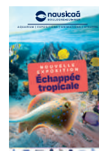
Dépliant grand public 14x21cm 12 pages