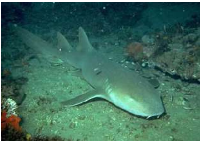
Le requin nourrice

C'est dans cet espace qu'évoluent les requins : requins taureaux, requins gris et requins nourrices. Ils se déplacent d'un côté à l'autre du bassin. Le renouvellement de l'eau autour des branchies est indispensable. Chez certains requins, comme les requins gris, l'ouverture et la fermeture rythmées des fentes branchiales ne se font pas. C'est pourquoi ils doivent se déplacer continuellement, la bouche ouverte, pour créer un courant d'eau alors que les requins nourrices n'ont pas besoin de nager pour respirer, l'ouverture rythmée des fentes branchiales suffit pour créer le courant dans la cavité buccale.