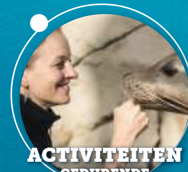
ACTIVITEITEN GEDURENDE HEEL JE BEZOEK