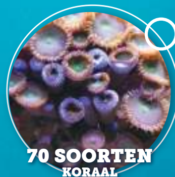
70 SOORTEN KORAAL

Je ontdekt er een unieke biodiversiteit en ver verwijderde ecosystemen, maar je leert ook dat de zee heel wat diensten levert aan de mens.