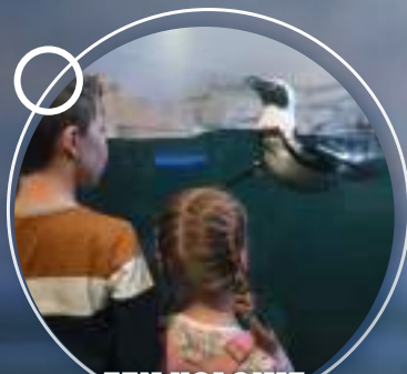
EEN KOLONIE VAN EEN TWINTIGTAL PINGUÏNS