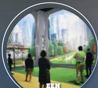
EEN INDRUKWEKKENDE RUIMTE MET 430 M 2 SCHERMEN, VAN DE VLOER TOT HET PLAFOND

Orkanen, smeltende ijskappen, stijging van de waterspiegel ... Maak je klaar voor een indrukwekkende reis naar het middelpunt van de gevolgen van de klimaatopwarming: een volledig nieuw parcours rond onze kolonie zwartvoetpinguïns, in een indrukwekkende ruimte met 430 m 2 schermen die van de vloer tot het plafond reiken. Ontdek aan het einde van deze expositie dat er oplossingen bestaan om het milieu te beschermen en meer ecologisch te gaan leven!