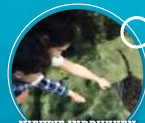
NIEUWE INDRUKKEN OPDOEN DANKZIJ HET AANRAAKBASSIN