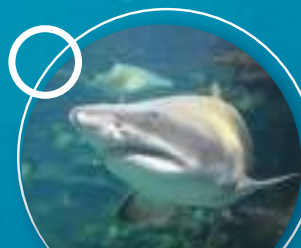
EEN TIENTAL SOORTEN HAAIEN