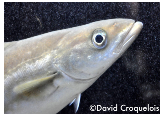
Les lieus jaunes.