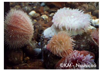
Oursin / Anémones de mer.