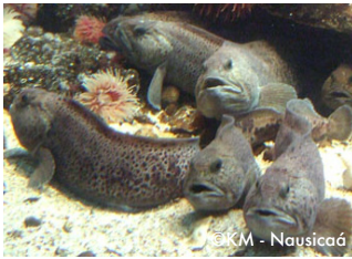
Les loups de mer.