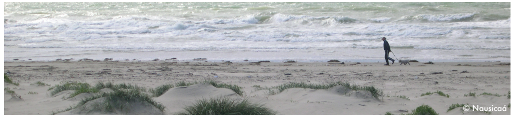
La côte d'Opale.