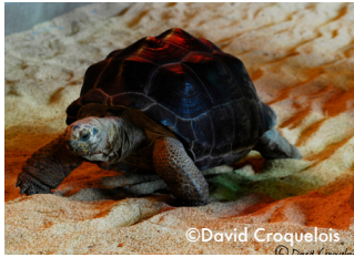
Une tortue terrestre des Seychelles