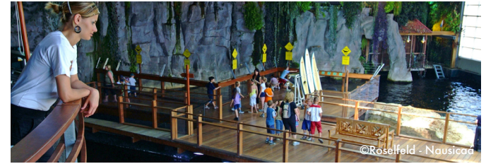
Le Tropical lagoon bar