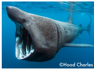
Le requin pélerin.