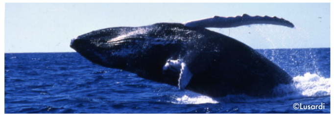
La baleine à bosse.