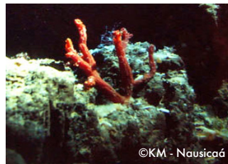
Le corail rouge.