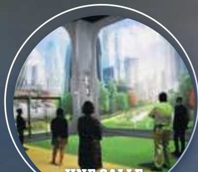
UNE SALLE IMMERSIVE DE 430 M 2 D'ÉCRANS DU SOL AU PLAFOND

Ouragans, fonte des glaces, montée des eaux... Préparez-vous à un voyage spectaculaire au cœur des effets du réchauffement climatique dans un tout nouveau parcours de visite à la rencontre de notre colonie de manchots du Cap et doté d'un espace immersif de 430 m 2 d'écrans du sol au plafond. À l'issue de cette exposition immersive, découvrez que des solutions existent pour préserver l'environnement et vivre de façon plus écologique !