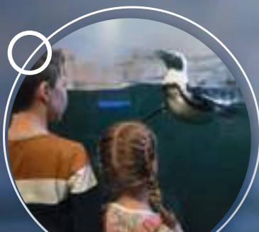
UNE COLONIE D'UNE VINGTAINÉ DE MANCHOTS